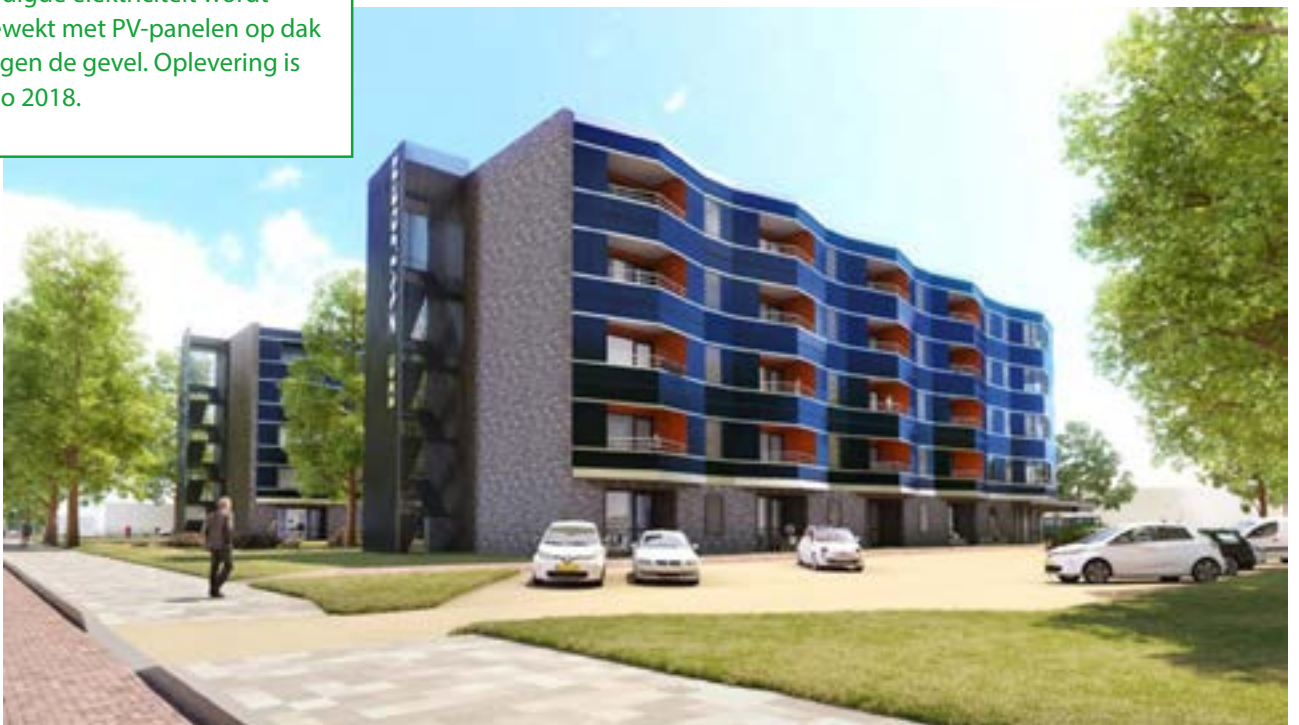
48 NOM-appartementen in Best met bodemwarmtepomp en PV-panelen op het dak en tegen de gevel.

In opdracht van Woningcorporatie 'Thuis' bouwt BAM Wonen in Best twee NOM-appartementengebouwen met 48 NOM-eenheden verdeeld over vijf verdiepingen. De woningen worden zeer goed geïsoleerd en voorzien van een bodemwarmtepomp en ventilatie met warmteterugwinning. De benodigde elektriciteit wordt opgewekt met PV-panelen op dak en tegen de gevel. Oplevering is medio 2018.