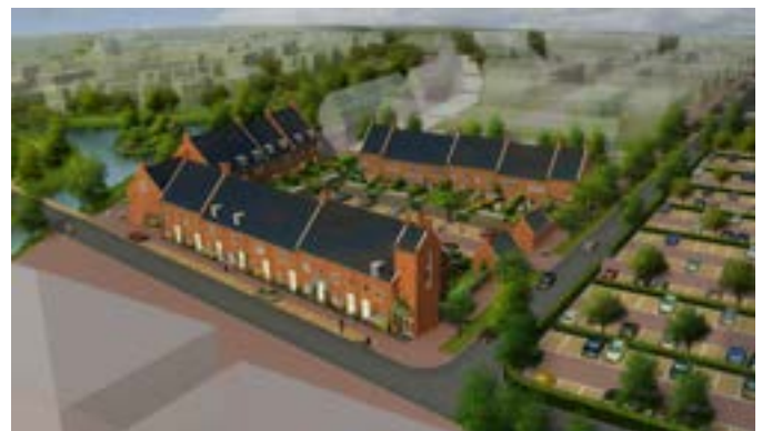
Nul-op-de-meter woningen ontworpen in Delftse School stijl. Met bodemwarmtepompen en PV, opgeleverd 2017. Ontwikkelaar AM, uitgevoerd door BAM Woningbouw.

Bij levering van warm tapwater is een temperatuur nodig waarbij legionellabesmetting wordt voorkomen. De regel die daarvoor in Nederland wordt gevolgd, is een temperatuur op de tappunten van minimaal 55 °C. Een warmwaterboiler moet regelmatig, bijvoorbeeld eens per week, kort op 60 °C worden gebracht om te desinfecteren. De nieuwste warmtepompen kunnen deze temperaturen leveren. Bij een collectief warmtenet (laag en midden temperatuur) kan hiervoor een individuele boosterwarmtepomp worden gebruikt.