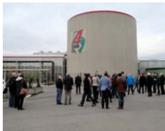
Geïnteresseerden op bezoek bij het geothermische project Ammerlaan in Pijnacker.