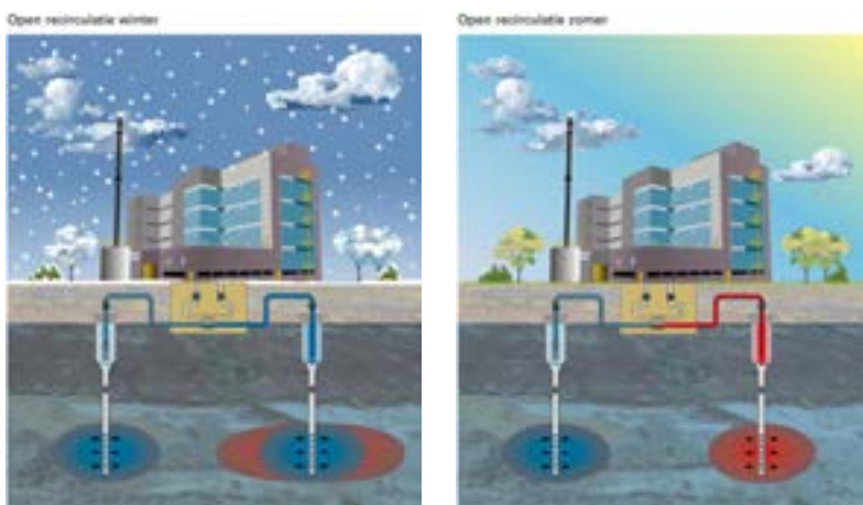
Principeschema warmte-koudeopslag met een open grondwaterwarmtepomp.