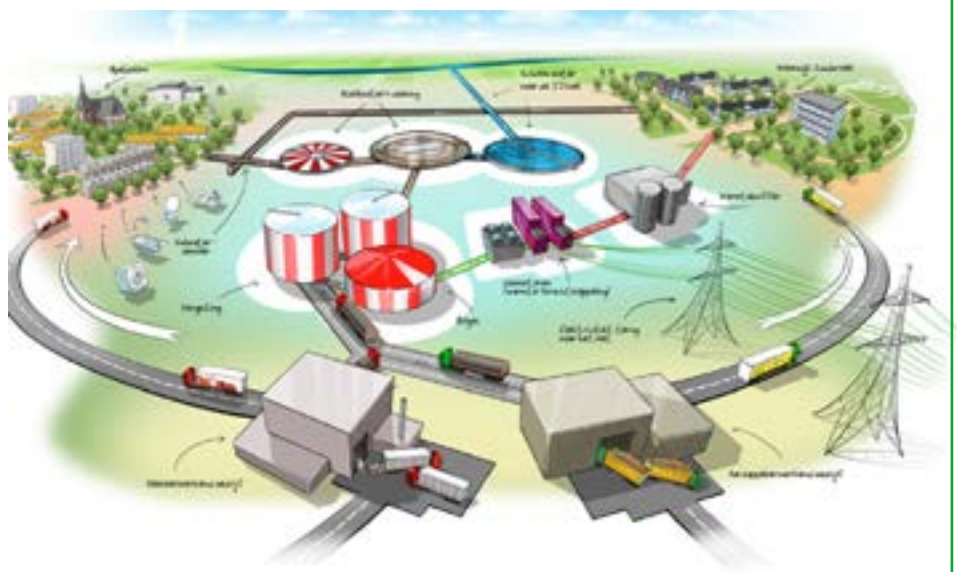
Schema Energiefabriek Apeldoorn

De rioolwaterzuivering van Apeldoorn is de eerste zogenaamde energiefabriek van de waterschappen. In de nieuwe wijk Zuidbroek krijgen 1500 woningen hiervan energie. Door de RWZI wordt rioolslib vergist en in biogasmotoren omgezet. In 2015 was dit goed voor 48% van de benodigde warmte in Zuidbroek. De rest werd geleverd door biomassaketels van Ennatuurlijk (38%) en aardgas (11%).