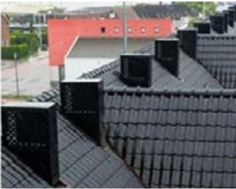
Individuele luchtwarmtepomp waarbij de buitenunit eruit ziet als een schoorsteen.