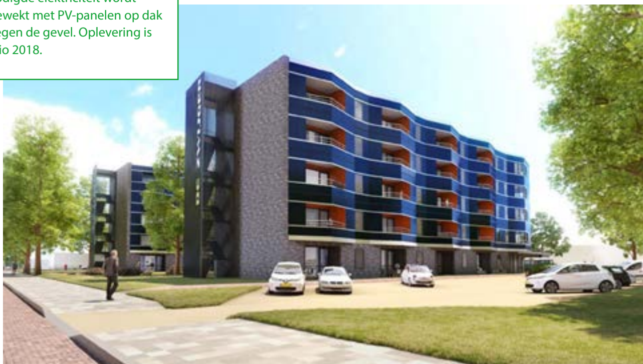
48 NOM-appartementen in Best met bodemwarmtepomp en PV-panelen op het dak en tegen de gevel.

In opdracht van Woningcorporatie 'Thuis' bouwt BAM Wonen in Best twee NOM-appartementengebouwen met 48 NOM-eenheden verdeeld over vijf verdiepingen. De woningen worden zeer goed geïsoleerd en voorzien van een bodemwarmtepomp en ventilatie met warmteterugwinning. De benodigde elektriciteit wordt opgewekt met PV-panelen op dak en tegen de gevel. Oplevering is medio 2018.