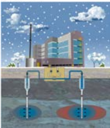
Open recirculatie winter