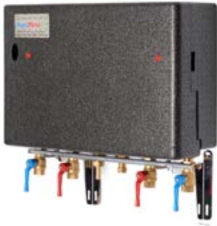
Afleverzet voor externe warmtelevering